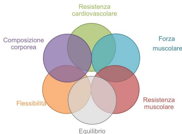
Fig. 2. Le 6 componenti della fitness legate alla salute.

Set di attributi ascrivibili alle persone, posseduti o raggiungibili, che sono in relazione alla capacità di eseguire attività fisiche. Vengono comunemente divisi in relativi alla salute (capacità cardiorespiratoria, forza e resistenza muscolare, flessibilità e composizione corporea) e relativi all'abilità motoria (Agilità, equilibrio, coordinazione, potenza muscolare, velocità e tempo di reazione). Quest'ultimi sono particolarmente importanti in ambito sportivo.