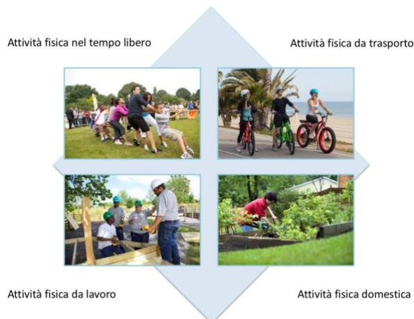
Fig.1. Domini dell'attività fisica